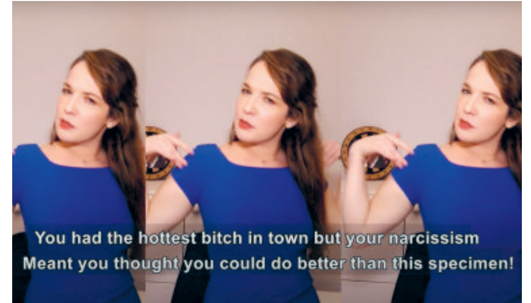
You had the hottest bitch in town but your narcissism Meant you thought you could do better than this specimen!